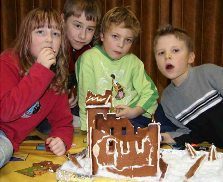
Här äter eftisbarnen upp sin pepparkaksborg. Granar och väggar och dörrar och torn blir mindre och mindre och kommer så småningom att försvinna helt och hållet!